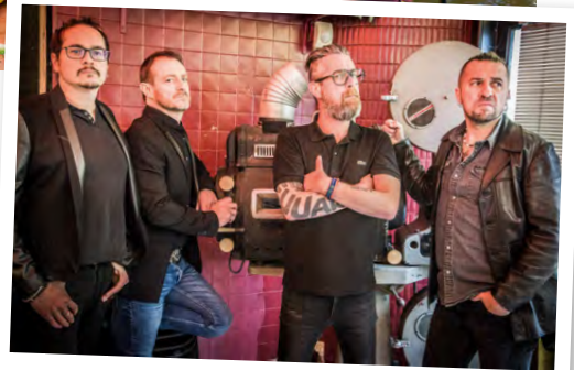
Les Fatals Picards en concert de clôture

Après la période Covid, l'édition 2022 amplifie le succès avec une fréquentation record de 25 000 visiteurs, confirmée en 2023. « Cette année, nous revenons pour une 6 e édition encore plus ambitieuse, annonce le Pays de Falaise. Les visiteurs pourront s'initier à une quarantaine d'activités de pleine nature, déguster les produits de nos producteurs locaux au sein d'un éco-village et de son marché, flâner au cœur d'une nature préservée en Suisse Normande, découvrir des mobilités douces, (stand mobilité, essais de